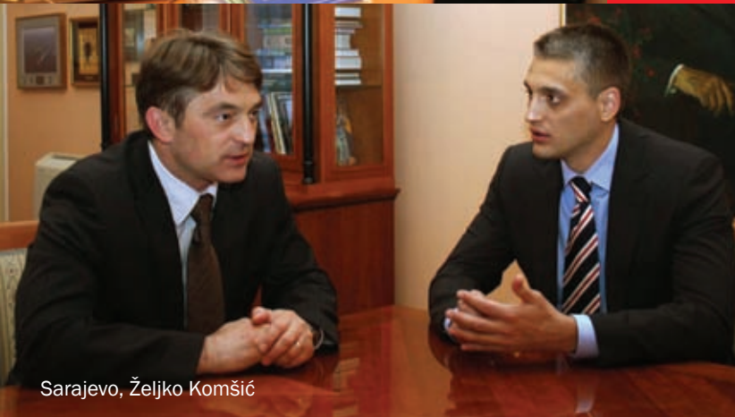
Sarajevo, Željko Komšić

U Sarajevo smo došli jer LDP želi da promoviše regionalnu politiku koja insistira na novim evropskim i modernim vrednostima, politiku koja neguje dobre odnose sa svim susednim zemljama.