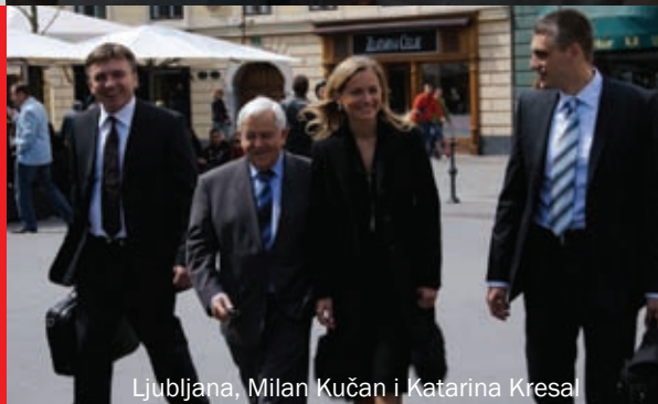
Ljubljana, Milan Kučan i Katarina Kresal