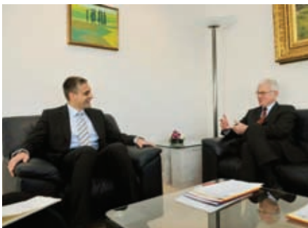
Brisel, Predsednik evropskog parlamenta, Hans-Gert Pöttering