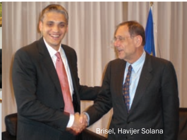
Brisel, Havijer Solana