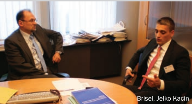
Brisel, Jelko Kacin

Moramo vratiti ambasadore u Ljubljana, ali i moramo da cenimo taj gest Slovenije koja je zadržala svog ambasadora i diplomate u Beogradu, uprkos februar-skom nasilju i napadu na ambasade.